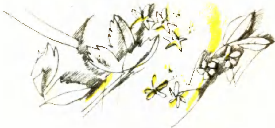
Рисунки В. Хромина